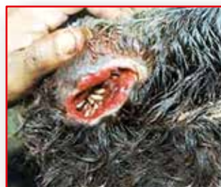
TRATAMIENTO CONTRA MIASIS