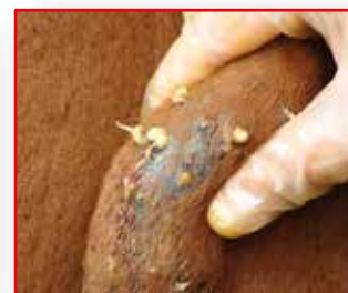
TRATAMIENTO CONTRA TUPE

98.7% DE CONTROL SOBRE EL CICLO PARASITARIO