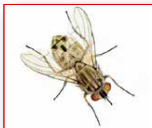
MOSQUICIDA MOSCA DE LOS CUERNOS